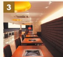
落ち着いた雰囲気を醸し出すメインホールのソファアール。