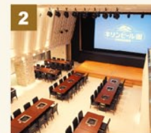
200インチのスクリーン。貸切時には様々なシーンに対応。