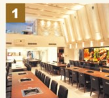
吹き抜け空間のメインホール。最大190名様まで。