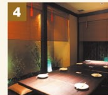
全15部屋の和個室。2～20名様まで収容可能。