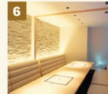
8階には洗練された雰囲気の漂う個室を9部屋ご用意。