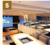
7階の吹き抜けメインホールを展望できる掘りごたつ席。